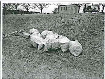
回収したゴミの置場所