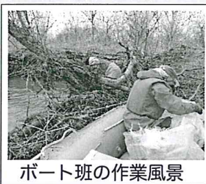
ボート班の作業風景

陸上班のみなさんは白川橋周辺にて終了予定時刻となりましたら流れ解散となります。回収したゴミは白川橋架橋付近へ集めて下さい。使用した道具類は事務局が回収に向かいます。