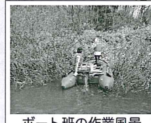
ボート班の作業風景