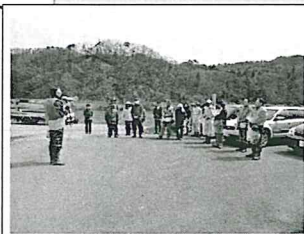
集合同所（開会のみ）