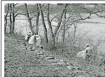
陸上班の作業風景