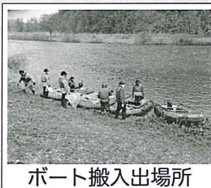
ボート搬入出場所